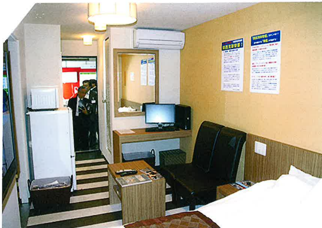
生活に必要な設備、家具・家電が全て揃っています。