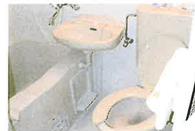
3点式ユニットバス