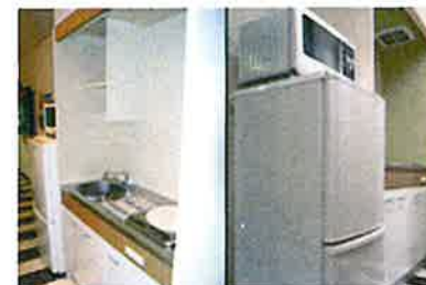
システムキッチン 冷蔵庫・レンジ